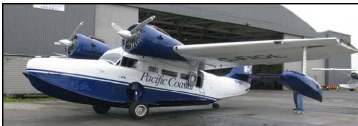
Photo 1. Grumman G-21A Goose

Le pilote était certifié et qualifié pour le vol conformément à la réglementation en vigueur. Il travaillait pour la compagnie depuis un an et demi. Il possédait de l'expérience de ce type de vol, et il totalisait 3998 heures de vol, dont 500 sur Grumman Goose (voir la photo 1). Le pilote avait suivi toute