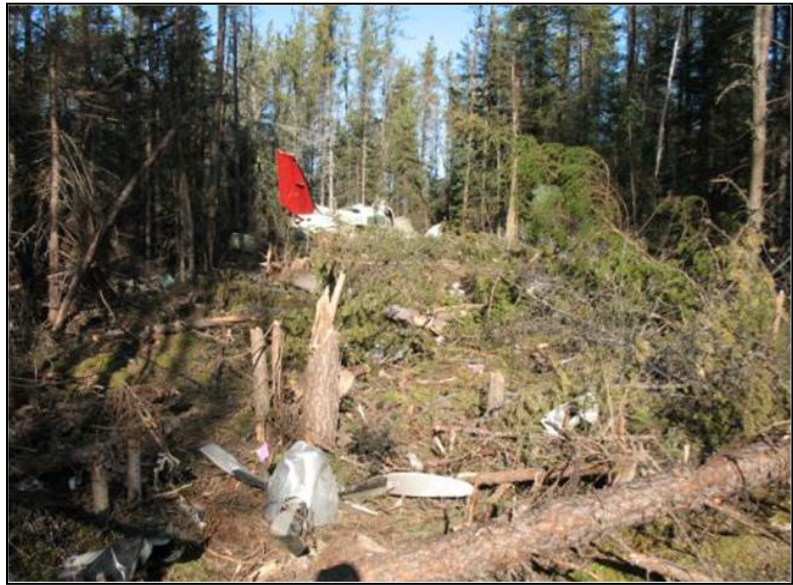
Photo 2. Point d'impact final

Une inspection de l'épave de l'avion, y compris des moteurs, des hélices et des commandes de vol, n'a révélé aucune anomalie antérieure à l'impact. Les instruments moteurs et le GPS ont été retirés de l'épave et envoyés au laboratoire du BST à Ottawa. L'analyse du