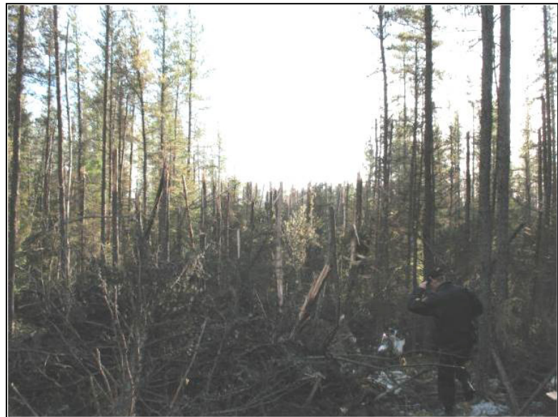
Photo 1. Dommages aux arbres

Les renseignements tirés des arbres heurtés et de l'épave indiquent que l'avion est entré en collision avec les arbres sur un relief ascendant dans une assiette quasiment horizontale (voir la photo 1). Sur les quelque 150 premières verges du contact avec les arbres, l'avion n'en touchait que la cime, puis il a endommagé et fauché de nombreux arbres sur les 150 verges suivantes avant que son fuselage restant ne s'immobilise (voir la photo 2). Le sillon laissé par l'épave était orienté selon un cap magnétique de 340 degrés, ce qui indique que C-GFIT s'éloignait du village de Cat Lake au moment de l'impact. L'épave était située à une altitude d'environ 1460 pieds asl.